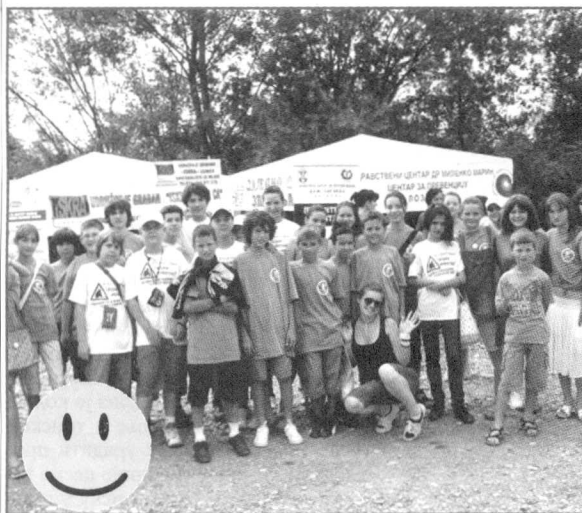
Они воле реку.