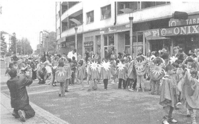
Маскенбал у центру Лознице

Дан планете Земље у Лозници обележен је маскенбалом на платоу испред Вуковог дома културе у којем су учествовала деца из вртића "Бамби", волонтери невладине организације "Искра", организације "ЕкоЛо" и запослени у превентивној служби лозничког здравственог центра. Акција је део пројекта "Образовање за заштиту животне средине у функцији одрживог развоја" који подржавају Швајцарска агенција за развој и сарадњу, град Лозница и Стална конференција градова и општина. Принципи на којима почива овај пројекат су