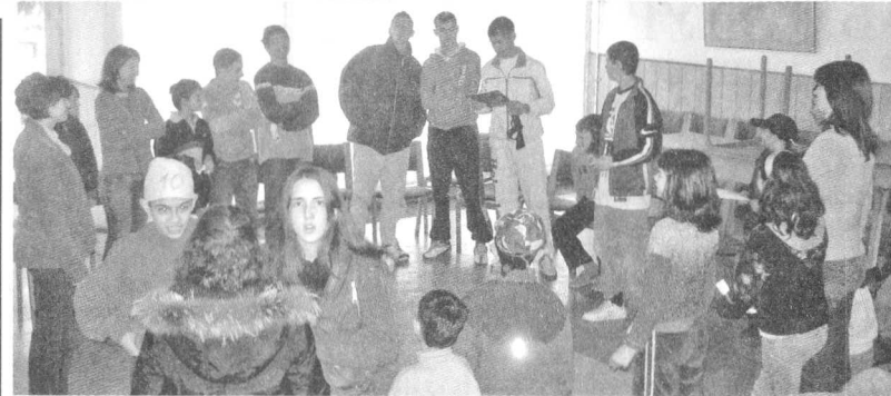
Обука у дому за незибринују децу у Бањи Ковиљачи