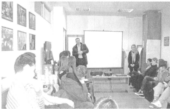
Радионица “Не пропуштај позиве”