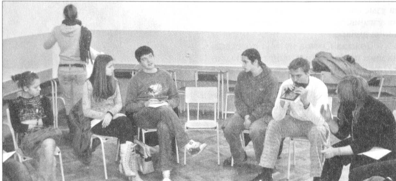
Волонтирају зарад бољег живота у својој средини

Неке од локалних организација НВО сектора које окупљају велики број младих волонтера су: уд-