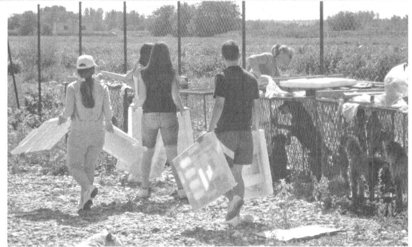
МЛАДИ У АКЦИЈИ