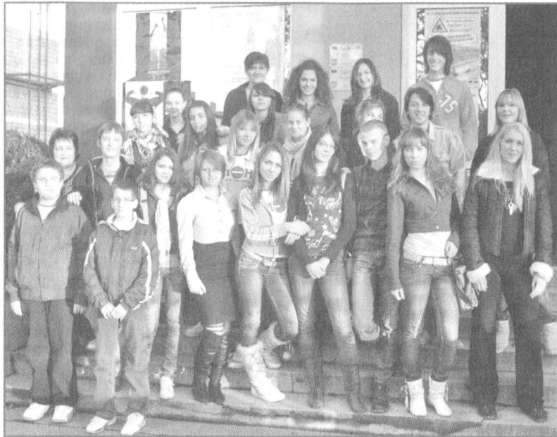
Наша мала редакција