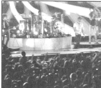
Предраг Костић - Слика са концерта