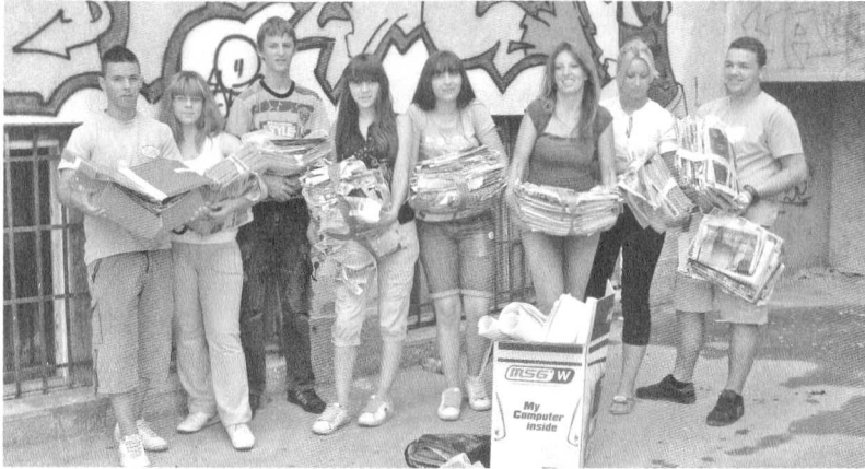
Еко-тим у акцији

Еко-тим састављен од Лозничких средњошколаца кренуо је са акцијама сакупљања старог папира. Млади из овог тима обучавали су се за заштиту животне